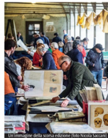
Un'immagine della scorsa edizione

fa di Pablo Picasso del 1951 e una di Jean Miro del 1971, due Litografie a colori di Marc Chagall firmate e numerate in soli 40 esemplari, e poi ancora un acquaforte di Rembrandt del 1654 e quella invecchiata di Gianbattista Tiepolo del 1745, fornite dallo Studio Fabrizio Pazzaglia di Urbino. Queste sono solo alcune delle rarità che si possono trovare nella vasta gamma della mostra mercato che vanta libri di pregio usciti dai torchi di stampatori famosi affiancati alle numerose curiosità bibliografiche, ampia anche l'offerta cartografica, che comprende mappe, atlanti, vedute e piante topografiche, e quella di stampe decorative d'epoca - sempre originali e garantite dalla serietà dei professionisti coinvolti.