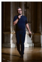
AVVIA CANTO IL CORPO DI VIENNA