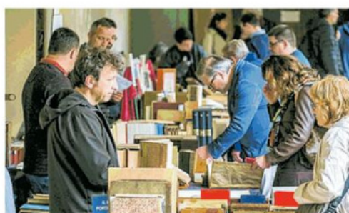
Visitori a un'edizione della mostra mercato al Diocesano

Sabato 16 e domenica 17 settembre torna nel chiostro del Museo Diocesano, in piazza Virgiliana 55, la mostra mercato Mantova Libri Mappe Stampe .